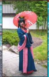
Shilocosplay en Yvantasy (namen voor Instagram)